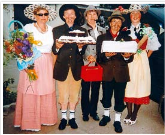
Komedia z kołoczem w okolicach Białej

uki gotowania i pieczenia. Przed upłynięciem świętych 12 nocy dziewczyna zadowolona, że nauczyła się czegoś pożytecznego, wróciła ponownie do swoich państwa. Gdy nadszedł radosny czas końca karnawału i każdy chciał zjeść coś szczególnie smacznego, dziewczyna upiekła swoim państwu ciasto, które sprawiło, że każdy kto go skosztował, wyrażał zachwyt. Inni, którzy go skosztowali byli również zachwyceni, wyrażając życzenie nauczenia się wypieku tego ciasta. W ten sposób w bardzo krótkim czasie kołocz z posypką – dar skrzatów – stał się ulubionym ciastem Ślązaków.”