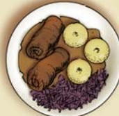
rolada, kluski, modro kapusta