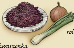
kwaszonka z czerwonej kapusty