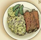
pańkraut z żeberkami